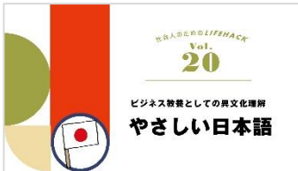
L-01 基本的なあいさつ