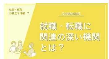
J-06 就職・転職に関連の深い機関とは？