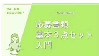
J-01 応募書類基本3点セット入門