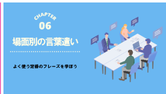
B-06 場面別の言葉遣い