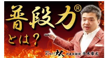
L-13 普段力 (R) とは？