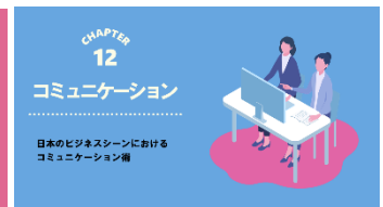
B-12 コミュニケーション