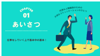
B-01 基本的なあいさつ