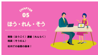
B-05 ほう・れん・そう