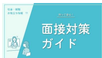
J-04 知って安心！面接対策ガイド